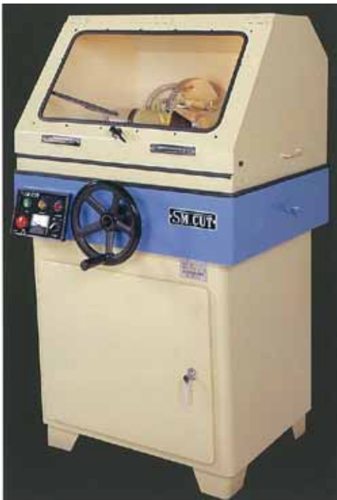
SM702CUD / 703CUD 型