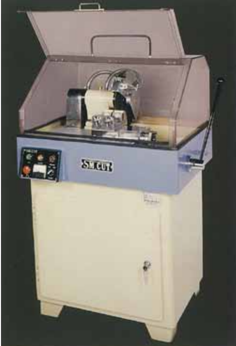
SM702C / 703C 型 (防水カバーは透明です。)