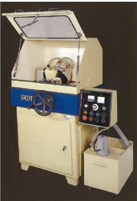
SM802A / 803AUD 型