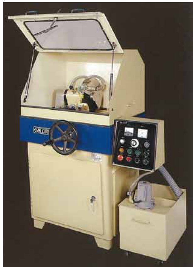
SM802A / 803A (UD) 型

※自動仕様にはシーケンサを組み込む事によりクイック切断ができます。(オプション) (砥石の目詰まり等を感じし、切断材に砥石が適していない時や硬い材料を切断する時に便利です。)