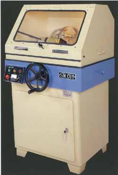
SM702CUD / 703CUD 型

SM602CUD / 603CUD / 602AUD / 603AUD SM702CUD / 703CUD / 702AUD / 703AUD SM802CUD / 803CUD / 802AUD / 803AUD