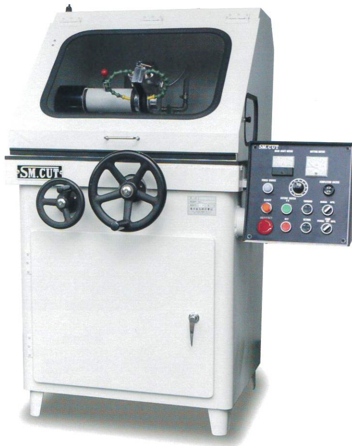
意匠登録・実新登録 SMN600/700/800A型

高精度に切断でき、切断時に熱影響の少ない湿式切断機、試料作製に最適。 バイス前後切断に加え主軸上下切断も可能。丸ハンドル方式採用し安定した切断が可能。 インバーター制御でパワフルで安定した自動切断が可能(A/WAシリーズ) 前面丸ハンドルで主軸位置を調整可能。砥石の摩耗時や切断位置の調整に最適。